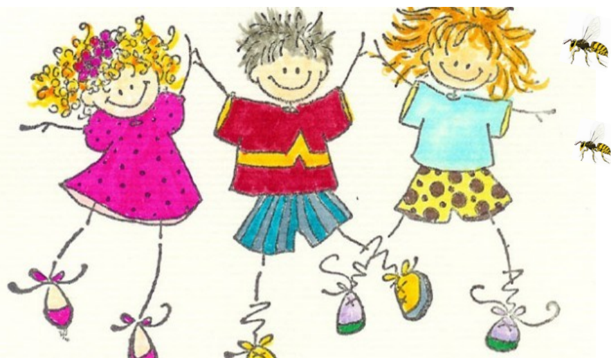
Några söta vårbilder i maj.